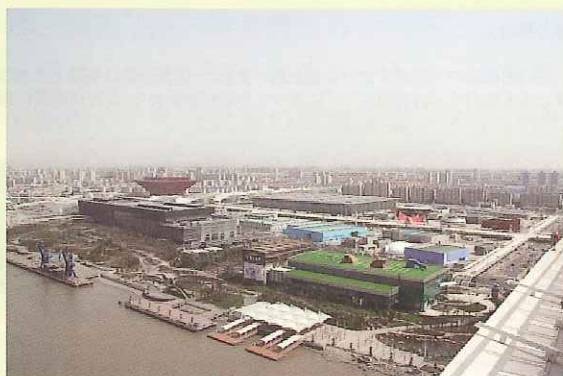
最後の仕上にとりかかる上海万博会場（中国館：写真左）