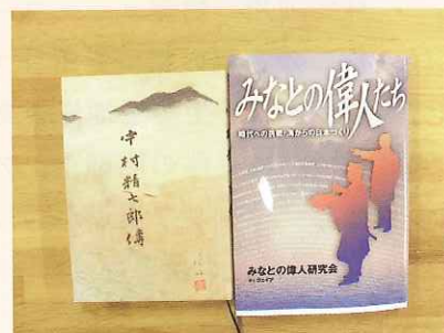
みなとの偉人たち と 中村精七郎傳