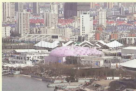
蚕の繭をかたちどった日本館