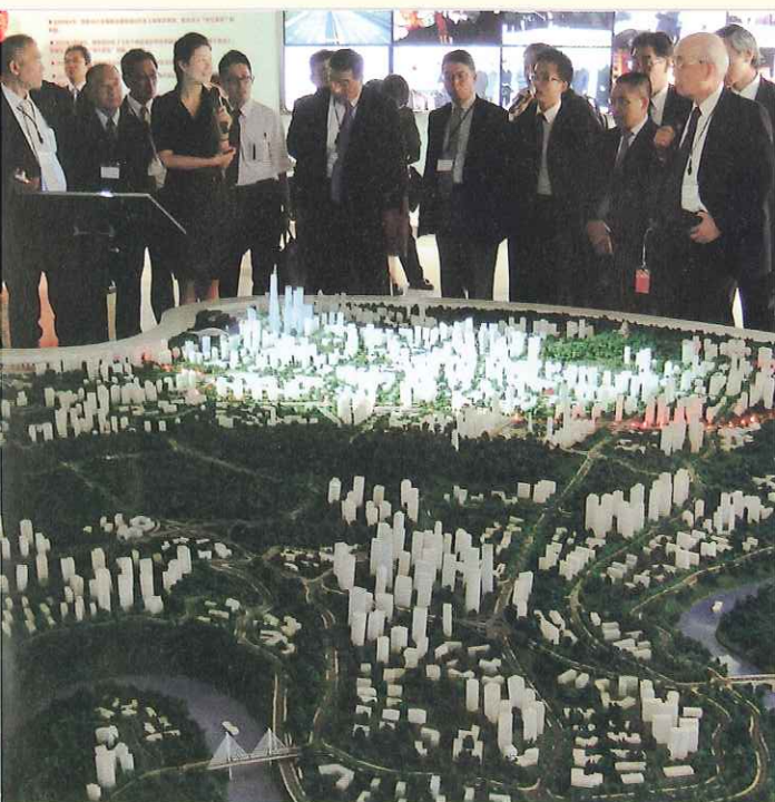
両江新区開発の巨大な完成模型を前に説明を聞く