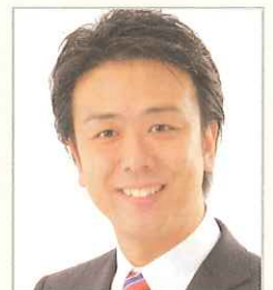
福岡市長 高島 宗一郎

いっぽう、九州新幹線の全線開通、博多～上海の高速RORO船の増便、福岡～ホノルルの航空便就航に続き、今年は海外クルーズ船の大型化と寄港回数増加が予定されるなど明るい話題も多く、福岡の大きな飛躍が予感される年でもあります。また、福岡市とボルドー市の姉妹都市交流締結30年目の年でもあり、私どもも大訪問団を組んでお祝いに花を添えたいと存じております。引き続き円高や、欧州債務問題、TPP参加交渉など世界経済の行方はいよいよ予測しがたく、また震災復興も道半ばですが、本年こそ会員の皆様にとって、よい年になりますことを祈念いたします。