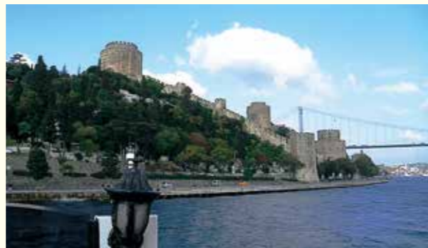
「麗しき 景色の裏の 寒さかな」

これは両国に限った話ではないことは周知の事実だろうが、ただ、キリスト教徒が多い韓国ではエルサレム巡礼などは日本人よりもよほど身近な物のようで、ガイドブックも普通にハングルの物があったし、さらに目を引いたのはトルコ遺跡の説明版の隅に「サムスン」とあったことである。あまり広告効果はないのかもしれないが、思えば一つ作ったところで大した金額にはならないのである。こういう所にも韓国の伸長と日本の委縮を見出す…というのはいった見方だと言われるであろうか。