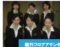
銀行フロアアテンダント