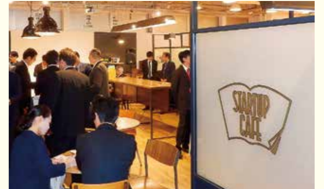
「スタートアップカフェ」 TSUTAYA BOOK STORE TENJIN（3階部分の一部）福岡市中央区今泉1丁目20番17号

泉の「TSUTAYA BOOK STORE TENJIN」内にオープン）に併設されます。