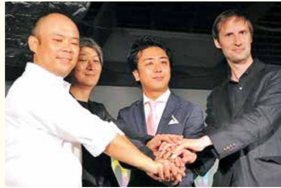
スタートアップ都市ふくおか宣言

それは、2011年9月にバンクーバーで開催されたIRBC（国際地域ベンチマーク協議会）に参加するため、経由地としてシアトルに立ち寄ったのがきっかけでした。マイクロソフト、スターバックス、コストコ、アマゾン、ボーイングといった世界に名だたるグローバル企業が、このシアトル