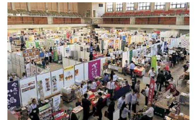
FOOD EXPO Kyushu (全景)