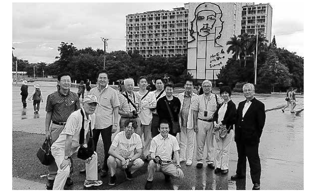
革命広場・ゲバラ像をバックに