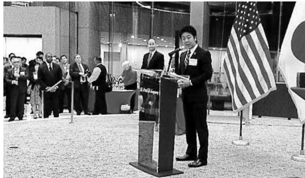
アトランタ市主催レセプションでの高島市長の挨拶

普段、行く機会が少ないアメリカ東南部のアトランタをベースにニューオリンズ、マイアミを訪問した。アトランタでは、アトランタ市長訪問（福岡市長）、福岡シテイプロモーション、アトランタ市主催レセプション、在アトランタ総領事館歓迎レセプション等々の公式行事に加え、デルタ航空本社、デルタ航空博物館・カーゴターミナル、コココーラ博物館、CNNスタジオとアトランタを代表する企業訪問と、ジェットロアトランタ森所長による東南部経済状況のブリーフィングと非常に内容が濃い時間にも追われるスケジュールであった。また高島市長の英語によるシテイプロモーションは好評でした。