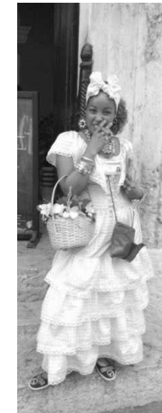
葉巻を売るキューバの少女