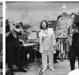
キューバ音楽とキューバ料理を堪能