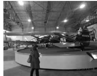
デルタ航空博物館・プロペラ機

また折角の機会であるので、アメリカ最南端、マイアミから160マイルに位置するキーウエストまで足を伸ばした。