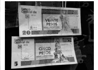
キューバ外国人用兌換ペソ