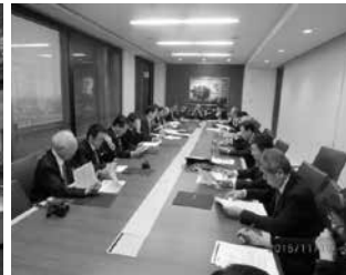
ジェットロアトランタ森所長のブリーフィング