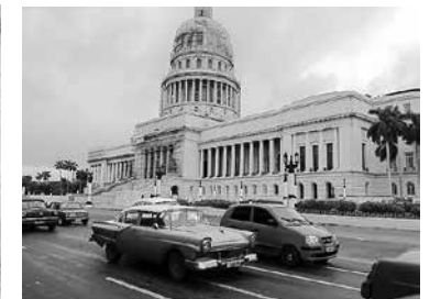
ハバナ旧国会議事堂とクラシックカー