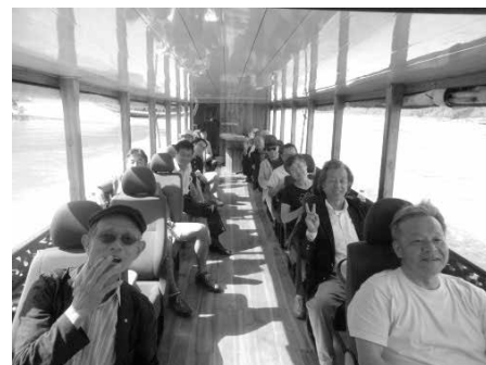
ルアンパバーンを巡るメコン川クルーズ