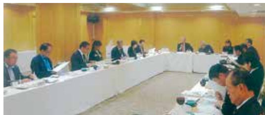
(福岡では、食品・外食産業などが「ねらい目」)

た。一方、海外ビジネスでは特有のリスクがあることを強調し、それに対して「福岡貿易会」等による適切なアドバイスが有効であり、当会への入会も案内しました。