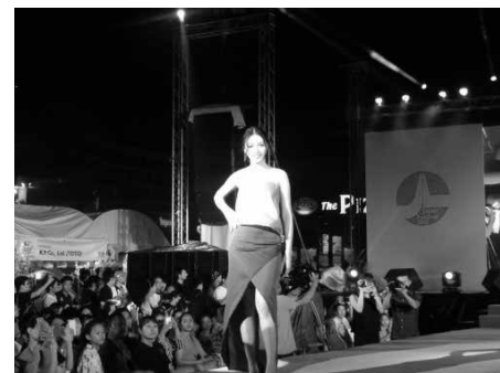
大盛会の FACo にミスラオス登場！

視察では、ラオスにおけるビジネス人材の育成や日本語教育の普及、文化交流の促進などに取り組むラオス日本センターや、福岡貿易会も、医療器具・ベッドの寄贈の輸送などに協力したラオ・アセアン・ホスピタル、九州人が構想から建設に携わり、今やそこで生み出される電力が、ラオス産業の中心を担